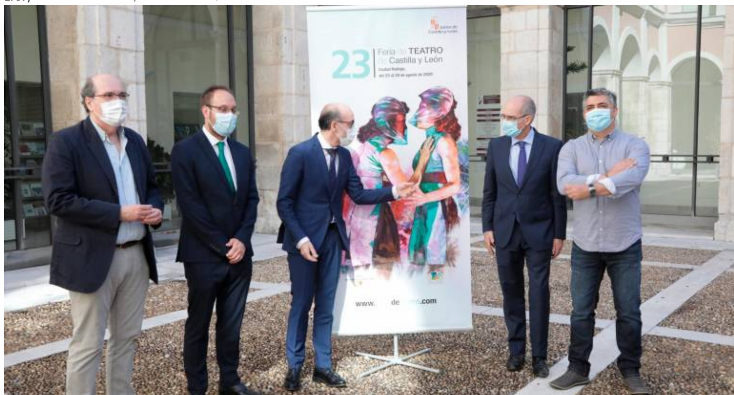
Un momento de la presentación de la Feria de Teatro de Castilla y León | JCYL

L.G./ CIUDAD RODRIGO / 29 JUN 2020 / 13:13 H.